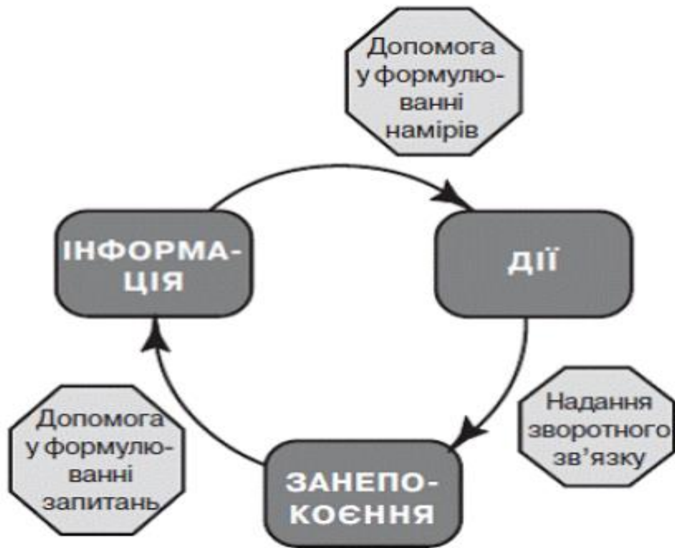
Рис. 2. Модель навчання за педагогікою емпатерменту